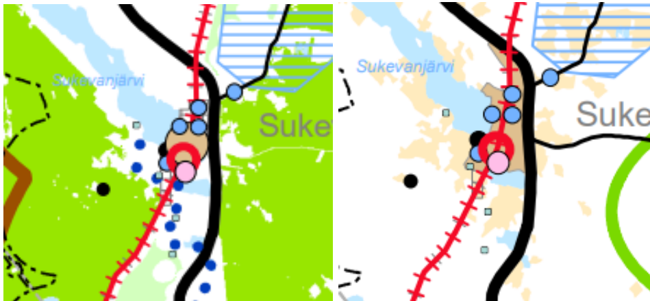
Kuva 4 ja 5: Ote Pohjois-Savon maakuntakaava 2040 luonnoksista. Vasemmalla VE1 Kyvy-käs uudistuja ja oikealla VE2 Rohkea kasvaja.