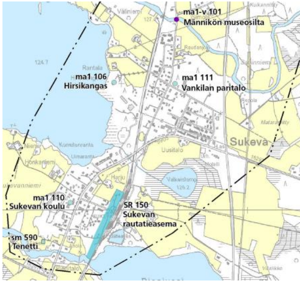
Kuva 3. Ote Pohjois-Savon maakuntakaava 2040:stä.