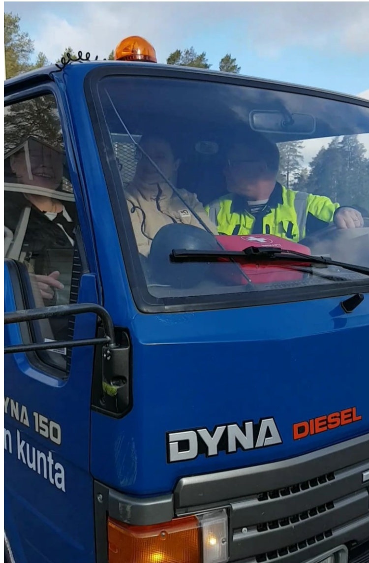
Teknisellä toimella käytössä oleva vuosimallin 1991 Toyota Dyna edustaa hyvin kunnallisen investointitoiminnan pitkäjänteisyyttä.