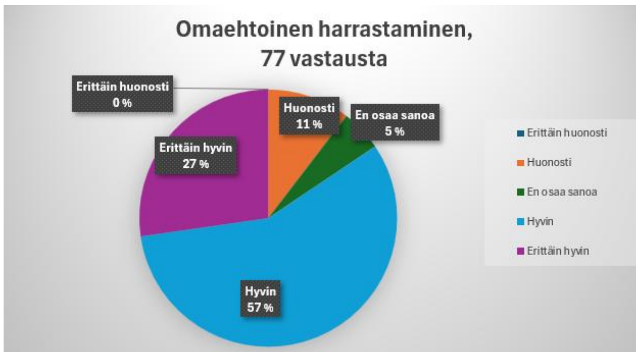
Kuvio 3. Vastaajien kokemus omaehtoisen harrastamisen toteutumisesta Sonkajärvellä