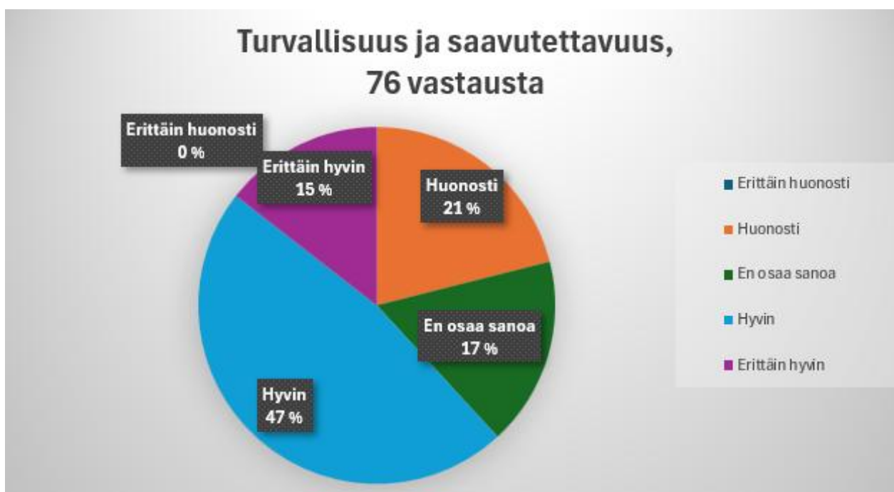
Kuvio 4. Vastaajien kokemus turvallisuuden ja saavutettavuuden toteutumisesta Sonkajärvellä