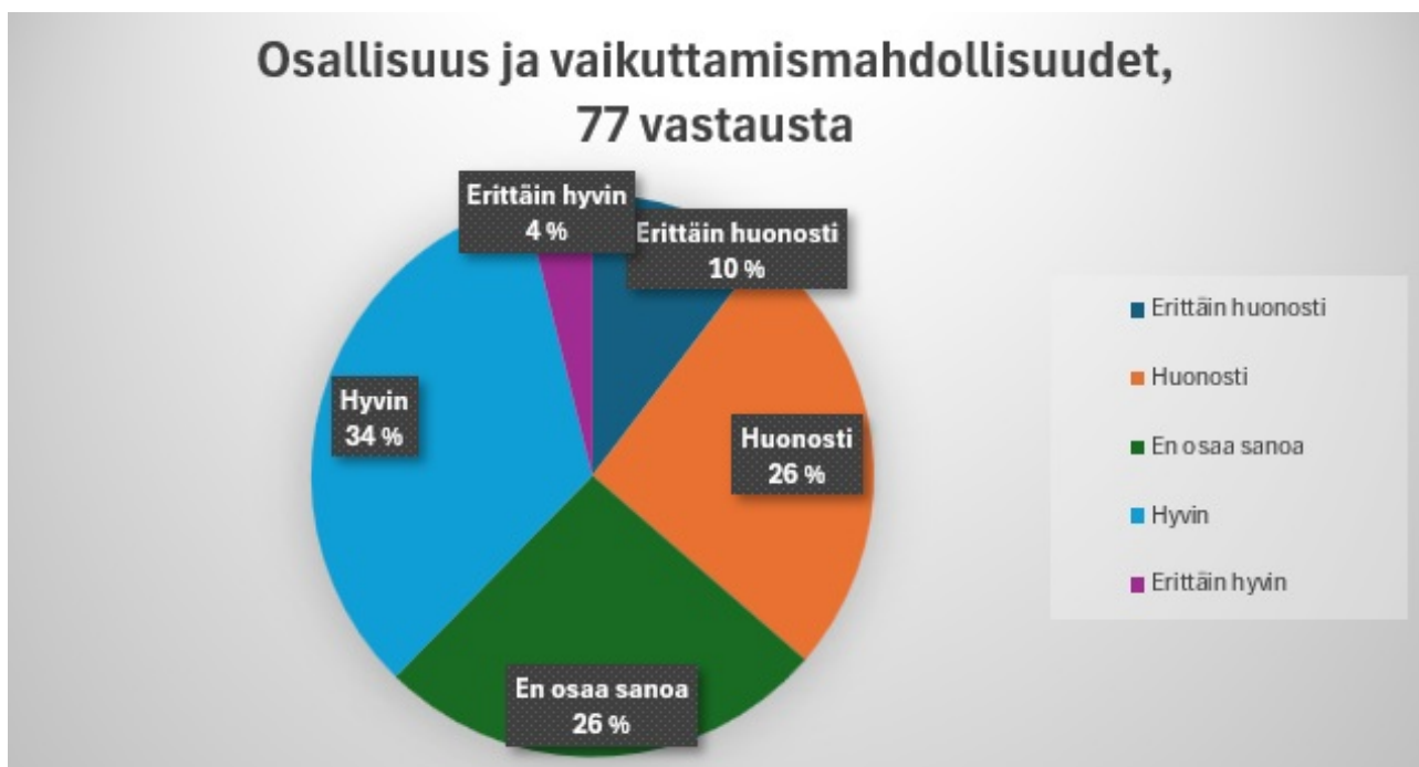
Kuvio 2. Vastaajien kokemus osallisuuden ja vaikuttamismahdollisuuksien toteutumisesta Sonkajärvellä