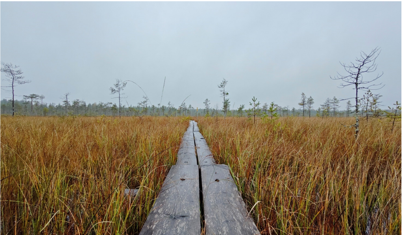
Kuva Mervi Suutarinen – Volokinpohku