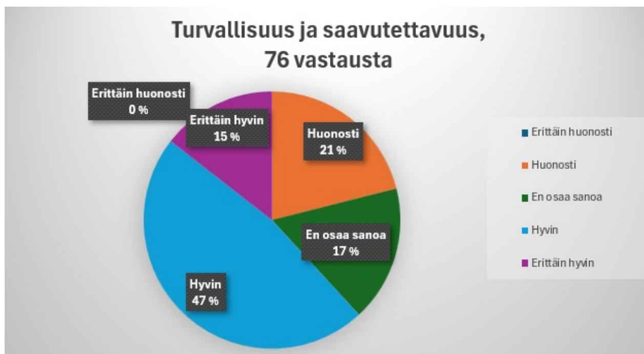
Kuvio 4. Vastaajien kokemus turvallisuuden ja saavutettavuuden toteutumisesta Sonkajärvellä