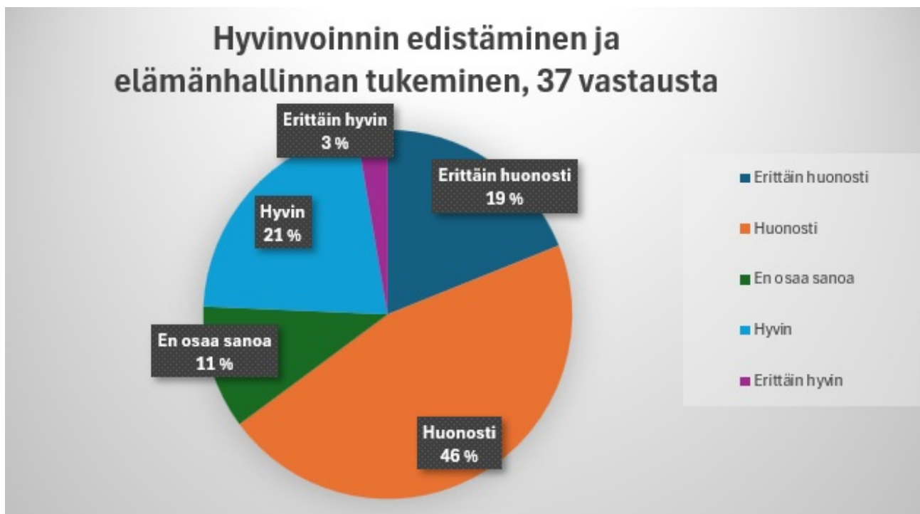
Kuvio 1. Vastaajien kokemus hyvinvoinnin edistämisen ja elämänhallinnan tukemisen toteutumisesta Sonkajärvellä