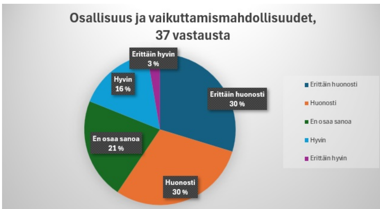
Kuvio 2. Vastaajien kokemus osallisuuden ja vaikuttamismahdollisuuksien toteutumisesta Sonkajärvellä