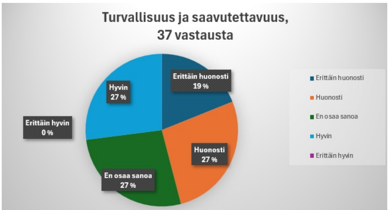
Kuvio 4. Vastaajien kokemus turvallisuuden ja saavutettavuuden toteutumisesta Sonkajärvellä

Avoimeen kohtaan kuntalaiset olivat perustelleet yllä olevia asioita: