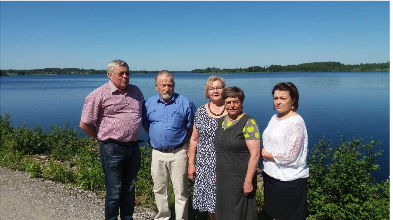
Tarkastuslautakunta Sukevalla v. 2020