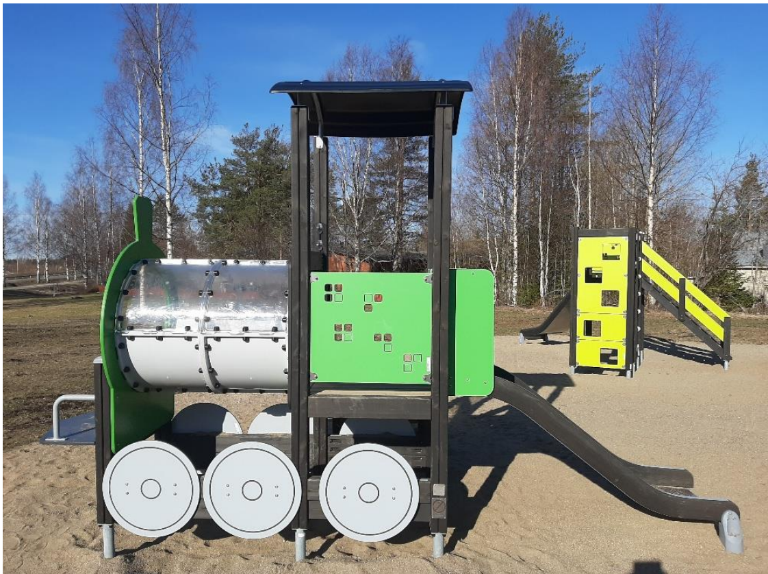
Kuvailu: kuva Sukevan leikkikentältä, jossa kiipeilyteline ja junan mallinen liukumäki